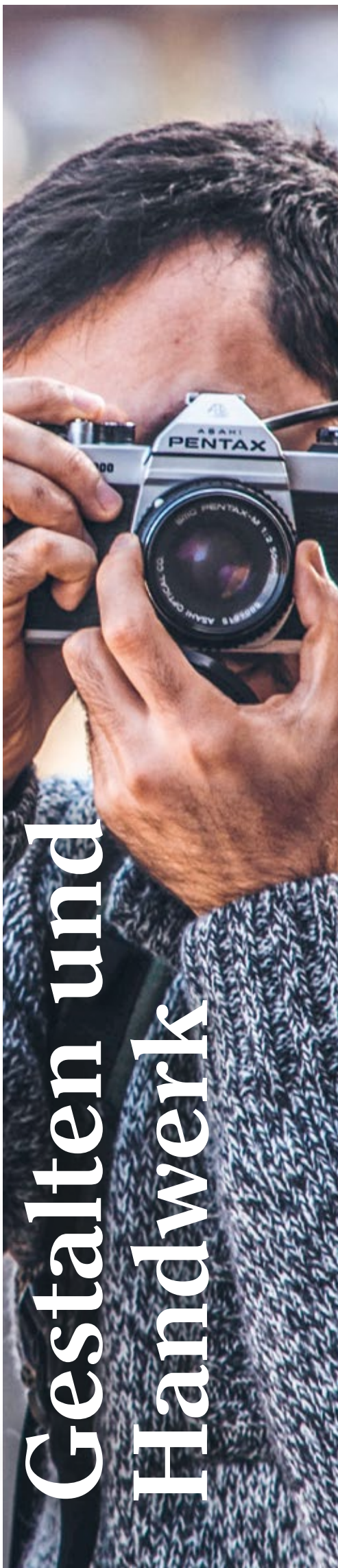
Foto und Video