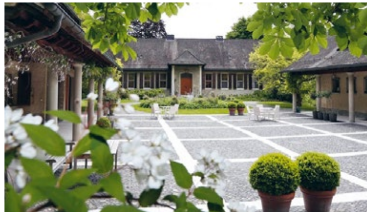
Die Stein Egerta ist der ideale Ort für Konferenzen, Tagungen und Kurse.

Atemstunde, Ute Blapp, Rietgarage 1. OG Gonzenstrasse 7